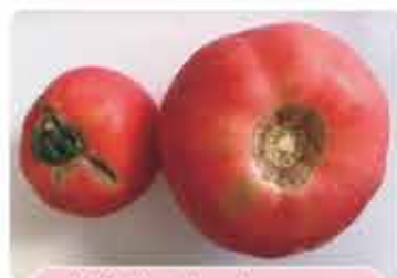
規格外のトマト

決められた大きさや形から外れた野菜は「規格外」と呼ばれ、流通させることができません。でも形も大きさもバラバラなのが自然の姿。例えば、野菜宅配の「大地を守る会」では「もったいナイシリーズ」として規格外の農産物が販売され、野菜販売サイトの「みためとあじはちがう店」では、規格外青果物を箱詰めして大田市場から直送しています。コロナ禍で「ポケットマルシェ」や「食べチョク」など、規格外を含めて生産者から直接購入できるサイトが大人気になりました。