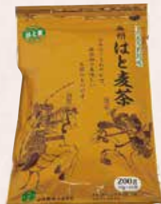
▲煮出して、ホットでもアイスでもお楽しみください。

「ふるさとパズル」正解者の中から抽選で10名に奥州市衣川産「はと麦」を100%使用し、風味豊かで癖がなくすっきりとした飲み心地が特徴の「はと麦茶（ティーバッグタイプ10g×20袋）」を進呈いたします。奮ってご応募ください！