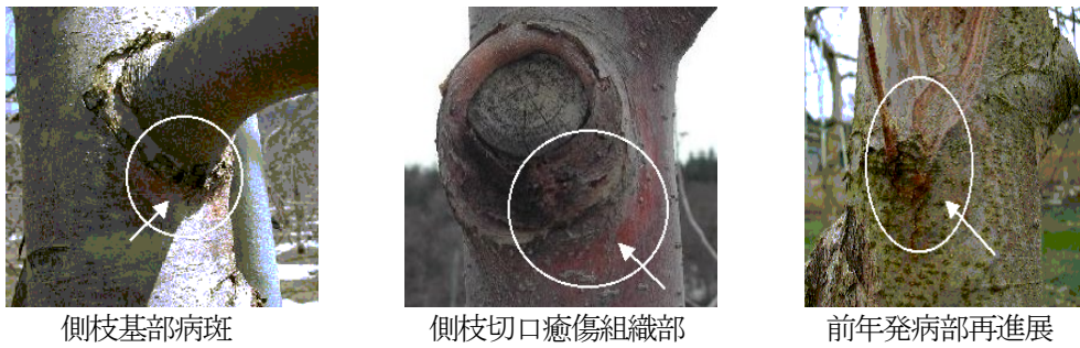
図1 わい性樹における主な胴腐らの発病部位