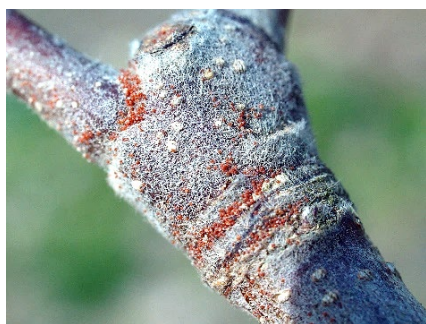
図 リンゴハダニの越冬卵